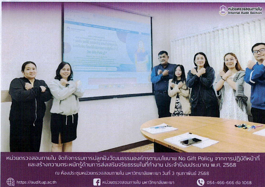
หน่วยตรวจสอบภายใน จัดกิจกรรมปลูกฝังวัฒนธรรมองค์กรตามนโยบาย No Gift Policy จากการศึกษา และสร้างความตระหนักรู้ด้านการส่งเสริมจริยธรรมในที่ทำงาน ประจำปีงบประมาณ พ.ศ. 2568 ณ ห้องประชุมหน่วยตรวจสอบภายใน มหาวิทยาลัยพะเยา วันที่ 3 กุมภาพันธ์ 2568