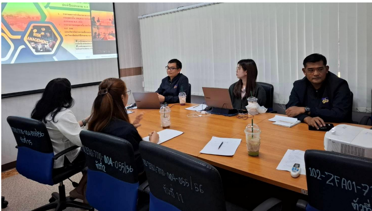
ภาพ 1 แสดงการประชุมบุคลากรของหน่วยตรวจสอบภายใน ตามมติและข้อคิดเห็นจากคณะกรรมการตรวจสอบฯ มากำหนดการขับเคลื่อนการปฏิบัติจริงในการพัฒนาระบบงานตามมาตรฐาน ครั้งที่ 1

ทั้งนี้ หัวหน้าหน่วยตรวจสอบภายใน ได้มอบหมายเจ้าหน้าที่บริหารงานทั่วไปรวบรวมข้อมูลผลการ พัฒนาบุคลากรของบุคลากรทุกคน เพื่อจัดทำเป็นรายงานผลการดำเนินงานตามแผนพัฒนาบุคลากรหน่วยตรวจสอบ ภายใน ประจำปีงบประมาณ พ.ศ. 2569 รอบ 6 เดือน และ 12 เดือน โดยนำมติและข้อคิดเห็นจากคณะกรรมการ ตรวจสอบฯ ชำรงต้น ไปปรับปรุงพัฒนาแผนพัฒนาบุคลากรหน่วยตรวจสอบภายใน ประจำปีงบประมาณ พ.ศ. 2569 เสนอต่อที่ประชุมหน่วยงาน, หน่วยงานผู้รับผิดชอบของระดับมหาวิทยาลัย, อธิการบดี และคณะกรรมการตรวจสอบ ประจำมหาวิทยาลัย ตามกระบวนการต่อไป